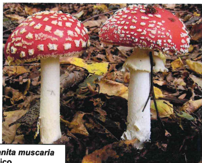
Amanita muscaria tossico