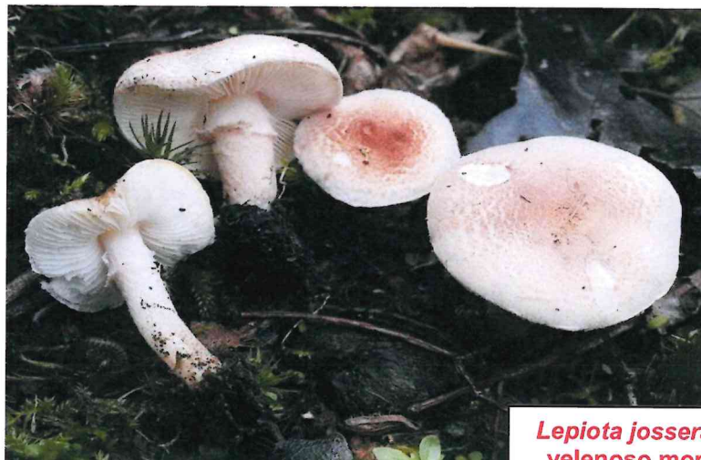
Lepiota josserandii velenoso mortale