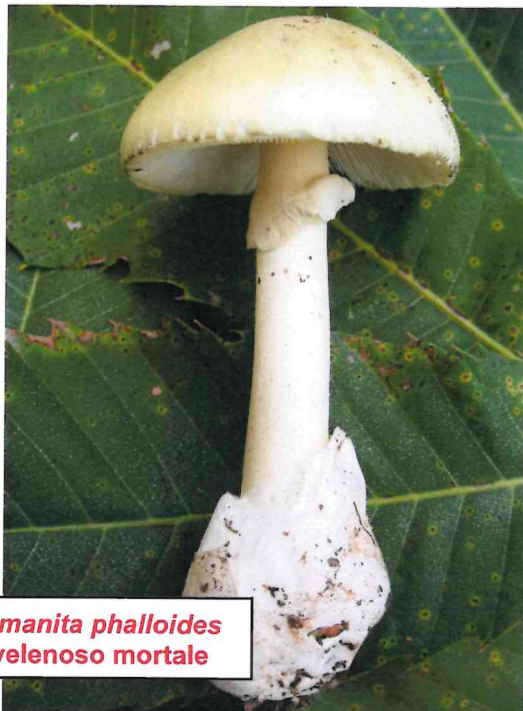
Amanita phalloides velenoso mortale